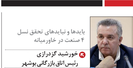
باید ها و نیاید های تحقق نسل ۴ صنعت در خاورمیانه

ج. هوش مصنوعی برای کاهش هزینه مبادله به کار گرفته شود.