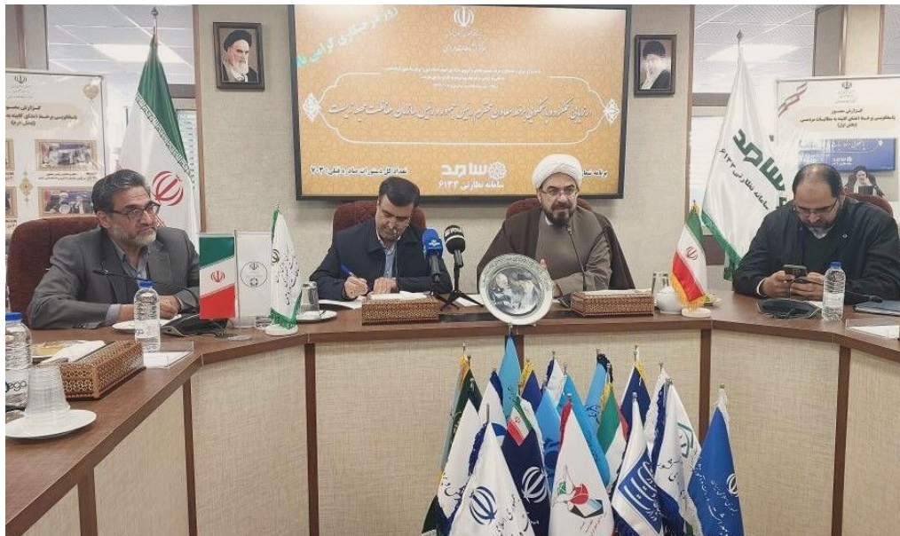
معاون هماهنگی امور اقتصادی استانداری خوزستان عنوان کرد: با اجرای این طرح به طور قطع تمرکز و محدودده این سازمان برای خدمات‌رسانی به مردم بهتر خواهد شد.

اکبر محمدی - رئیس سازمان حفاظت محیط زیست برای چهارمین بار با حضور در محل مرکز ارتباطات مردمی ریاست جمهوری به طور مستقیم به پرسش‌های شهروندان در موضوعات مختلف مرتبط با حوزه کاری خود پاسخ داد.