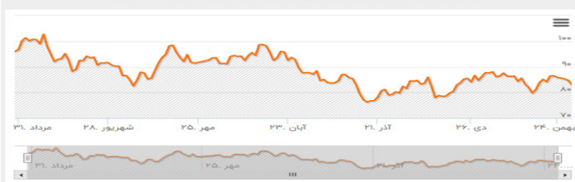
نمودار عملکرد ۳ ماهه شاخص

میانگین شاخص در بازه ۶ ماهه: ۸۹ میزان اختلاف شاخص در روز جاری با میانگین ۶ ماهه: ۵.۸۵ دلار درصد اختلاف شاخص در روز جاری با میانگین ۶ ماهه: ۷.۰۴٪