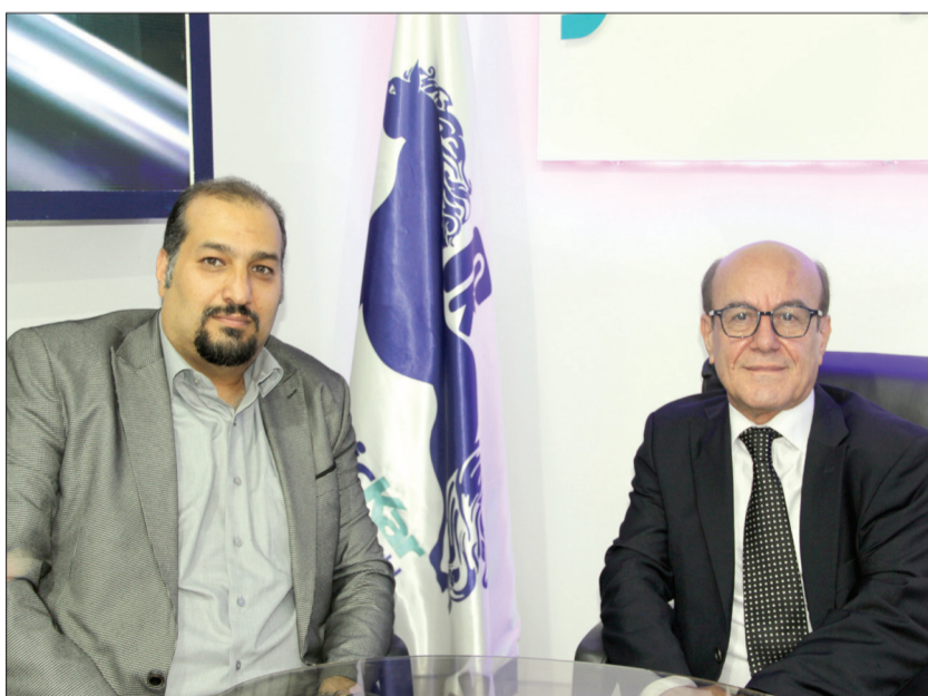
وی با اشاره به ظرفیت تولید شرکت پلاستیک کار اظهار داشت: سالانه ۵۰۰ هزار تن ظرفیت تولید داریم و در آینده فاز ۲ کارخانه با هدف بار و بیکر صادراتی و دانش بنیان تاسیس خواهد شد.